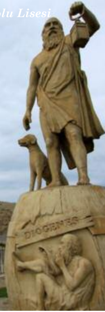
Sinop kalesi yakınlarındaki Diogenes heykeli

MÖ 412 - MÖ 323 yılları arasında yaşamış Kinik felsefesinin öncüsü ünlü filozoftur. Sinop'ta doğmuş Korint'de ölmüştür. Diogenes, medeniyeti reddetmiş ve medeniyet içerisinde medeniyetten uzak bir şekilde yaşamaya çalışmış bir antik çağ filozofudur.