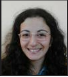
Hazırlayan: Zeynep Öztürk 10-B