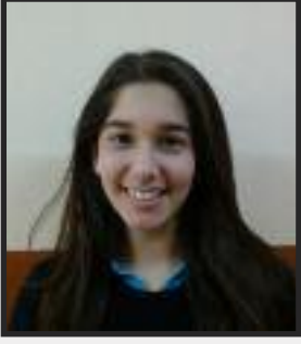
Hazırlayan: Ekin Görür 11-D