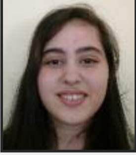
Hazırlayan: Algı Ağca 10-B